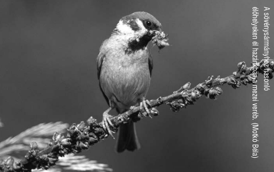
A sövényármányhoz hasonló élőhelyeken el hazánkban a mezei veréb. (Mortko Béla)