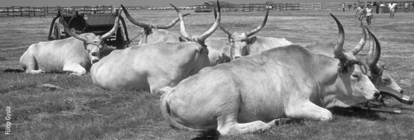
Delelő szürkemarka csorda a Hortobágyon.

III) Ahhoz, hogy a környezetvédelmi célkitűzések megvalósuljanak, a támogatás elnyerésének feltétele kell, hogy legyen egy közös környezetvédelmi kiindulási állapot elfogadása: a Helyes Mezőgazdasági és Környezeti Állapot valamint a Helyes Mezőgazdasági Gyakorlat, de legfőképp a Helyes Gazdálkodási Gyakorlat követelményeinek összhangja, minden érintett Tengely esetében. Ezeket az előírásokat a későbbiekben a keresztmegfeleltetés („cross compliance”) alapkövetelményei fogják felvállalni.