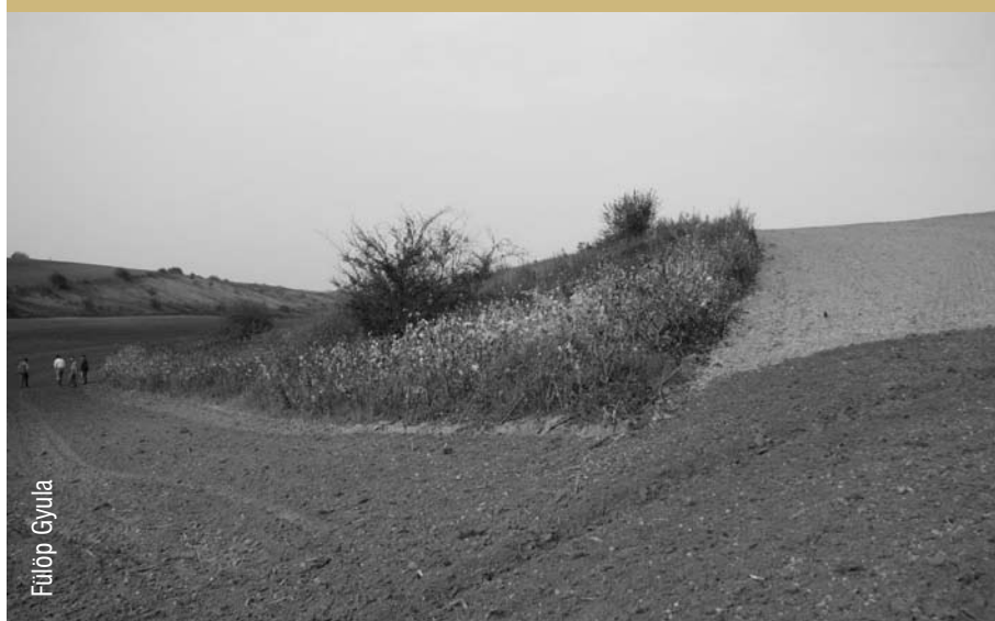
A gyepek élővilága a szántók szorításában kis töredékekre szorul vissza (Mezőföld).

Az AKG támogatásokra a hazai Vidékfejlesztési Stratégia teljes költségvetésének csak kb. 20-25%-a jut. Ez nem elegendő a gazdálkodók környezetbarát földhasználattal összefüggő igényeinek kielégítésére. Gyakran nem tudja felvenni a versenyt az I. Tengellyel, vagy a II. Tengely anyagilag jobban megtérülő egyéb támogatási lehetőségeivel. Például az AKG támogatások időtartama legkevesebb