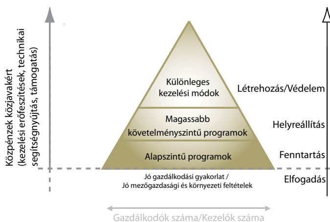
1. ábra: Az agrár-környezetgazdálkodás ajánlott felépítése Európában.

1) Az Élőhely- illetve a Madárvédelmi Irányelvűl fakadó földhasználati korlátozások hatásait kompenzáció formájában kell megtéríteni a gazdáknak, erdőtulajdonosoknak és más földhasználóknak (pl. kifizetések keretében, de más térségi kompenzációs megoldások is elképzelhetők). Ezeknek a kompenzációknak tükrözniük kell az egyes Natura 2000 területek természetvédelmi céljaival összefüggő sajátos élőhelyfenntartási követelményeket, melyeket pedig az illetékes hatóságoknak kell meghatározniuk a kulcsfontosságú érdekeltekkel konzultálva. A folyamatos monitorozás és értékelés szerves részét kell, hogy képezze ennek a folyamatnak.