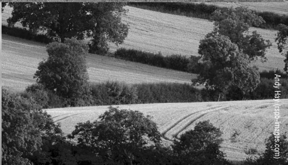
Andy Hay (rsob-images.com)