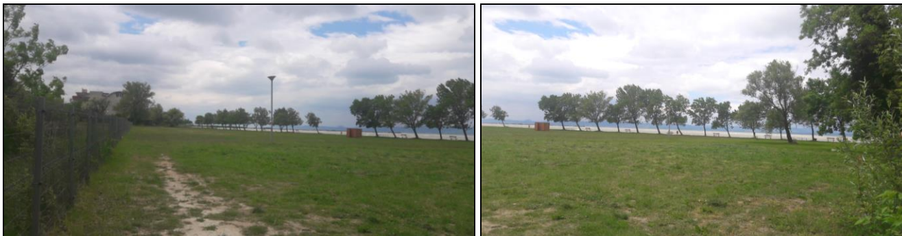
A 623 hrsz-ú, önkormányzati tulajdonba átadott zöldterületi csereterület – megvalósult (folytatódó) parti sétánnyal

A módosítások során a több mint 10 éve fennálló rendezetlen jogi és területhasználati helyzet (magántulajdonú tervezett zöldterület) megoldódik, miután a zöldterületek kisajátítása nem történt meg és erre sem a Magyar Államnak, sem az önkormányzatnak lehetősége nincsen. A módosítással a 951-953 hrsz-ú parti területek mai területhasználata gyakorlatilag nem változik, beépítetlen zöldfelület marad, a zöldterületi pótlást a Magyar Állam biztosította a 623 hrsz-ú parti beépítetlen telek önkormányzati tulajdonba adásával. A szükséges hosszú parti sétány is így ezen és a szomszédos 625/2 hrsz-ú önkormányzati tulajdonú területeken biztosítható, illetve ma már meg is valósult a 623 hrsz-ú telek megnyitásával.