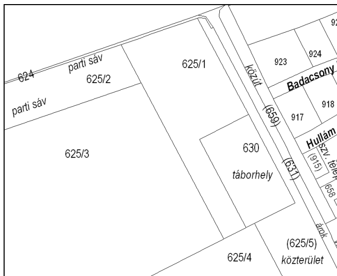
Földhivatali alaptérkép 2014

A fenti két térkép alapján is látható, hogy a telekalakítások következtében a VPRT alaptérképéhez képest minden környező érintett telek helyrajzi száma változott.