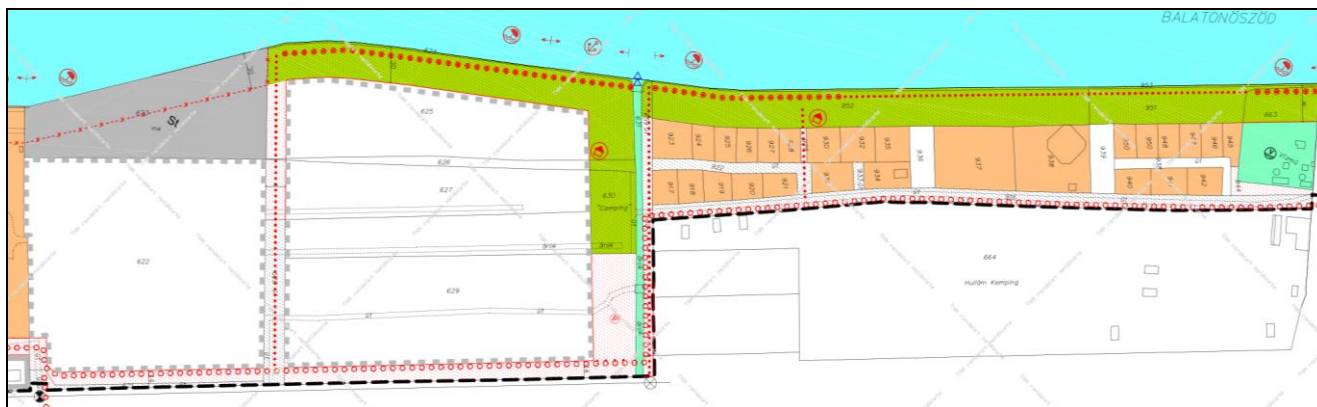
Hatályos Vízpart-rehabilitációs tanulmányterv részlet