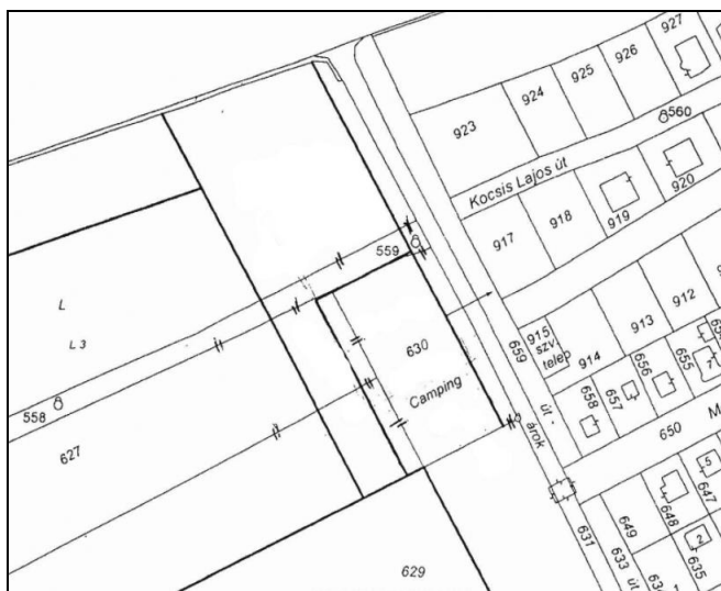
Telekalakítási vázrajz részlet 2007

A 630 hrsz-ú telek zöldterületbe sorolt terület így 2150 m 2 , a telek kisebb része pedig a szomszédos, részlegesen összevont területfelhasználási egységbe tartozik.