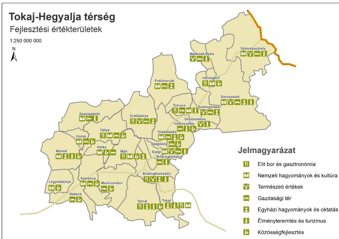
2. ábra: A Tokaji borvidék identitástérképe

A fenti fejlesztési értékterületeket mindegyik település esetén azonosítottuk, ezen értékterületek mentén van a legnagyobb potenciál a fejlesztések során, akár konkrét projektek kidolgozására. Tokaj-Hegyalját egy komplex, de mégis sokszínű mozaikká tudjuk összerakni, minden olyan értéket megjelenítve, amelyekben a települések erősek. A társadalmasítás folyamata során lehetőség nyílik az értékterületek megvitatására, a települések közötti kapcsolatok alakítására, kisebb, funkcionális mikrotérségek szerveződésére is.