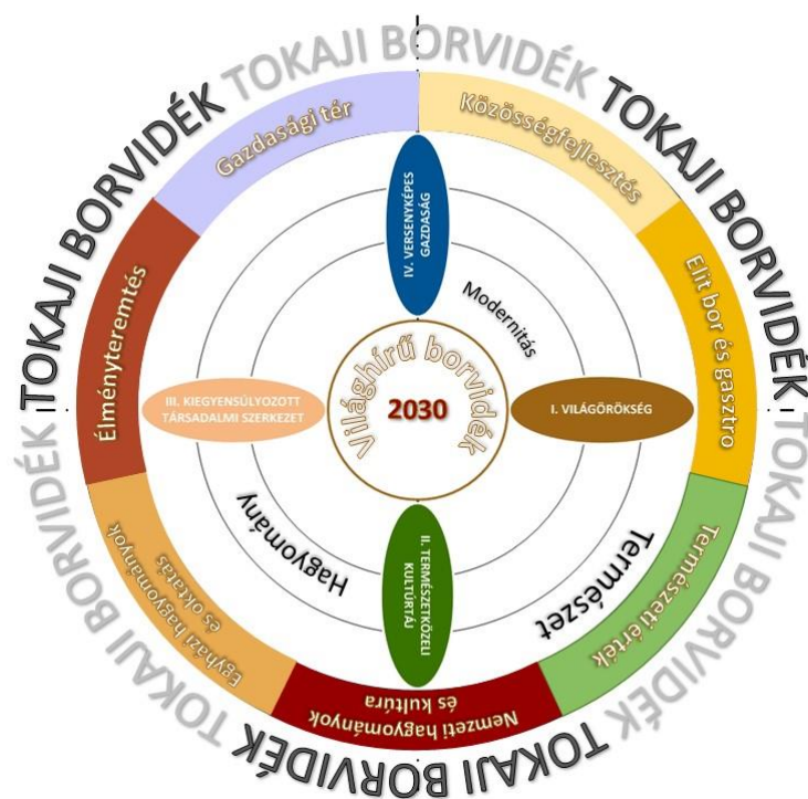
1. ábra: A területfejlesztési koncepció jövőképe és célrendszere

A Tokaji borvidék a fejlett és fenntartható természet, társadalom és gazdaság térsége, melyet az egyedi értékeken alapuló hagyomány és modernitás harmóniája jellemez.