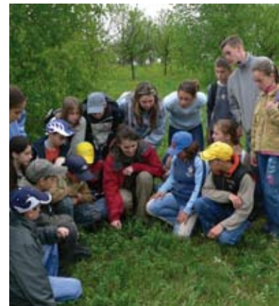
Bevezetés, a vidéki Európa

Az Európai Unió elmúlt években bekövetkezett öröndetes bővülése kemény kihívások elé állítja az unió strukturális és vidékfejlesztési politikáját, a mezőgazdasági üzemméretekben észlelhető szélsőséges különbségek és a vidéki térségekben regisztrált magas