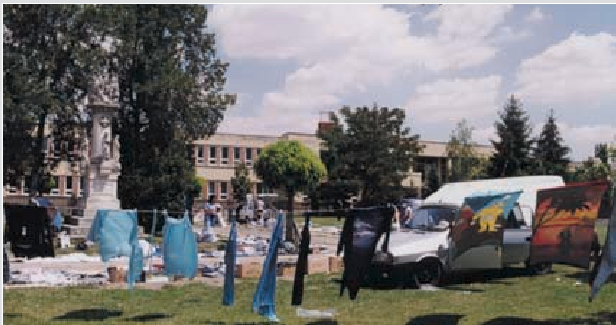
A település főtere 2003-ban