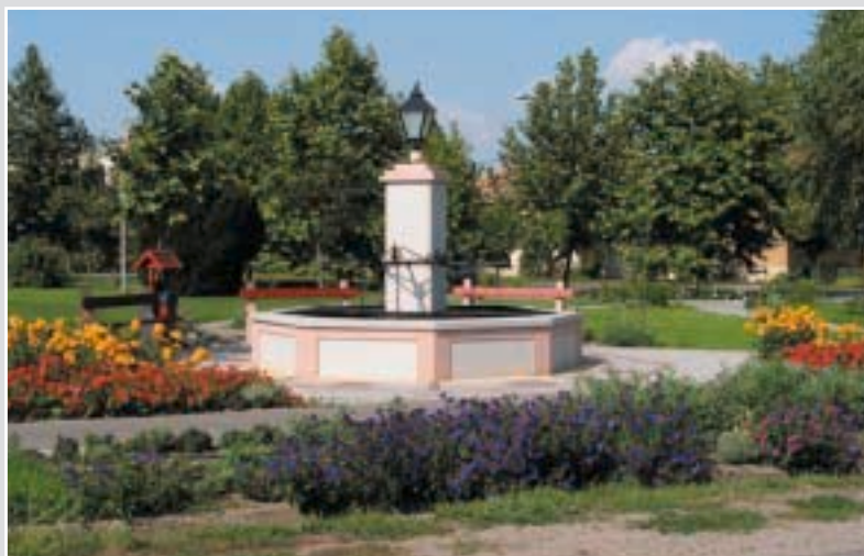
A község régi kútja 2004-ben... ...és 2005-ben