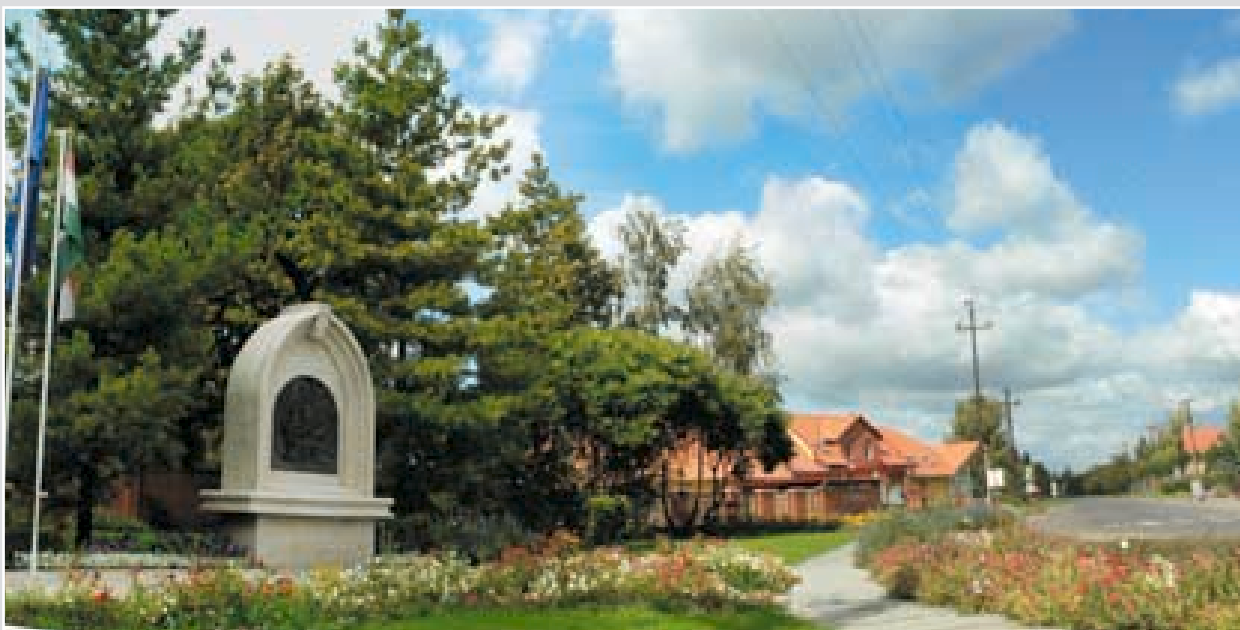
A millenniumi emlékmű előtti tér is megújult 2007-ben