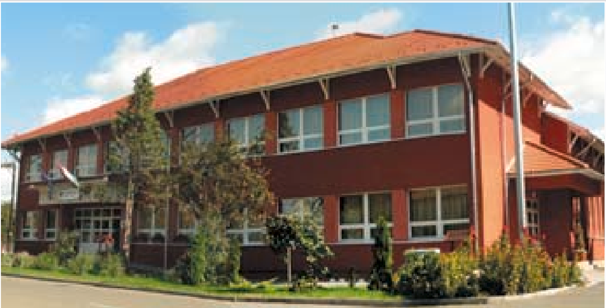
AVOP-támogatással újult meg a faluház 2006-ban