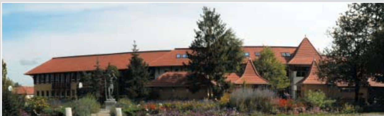
Virágpompa az iskola előtt