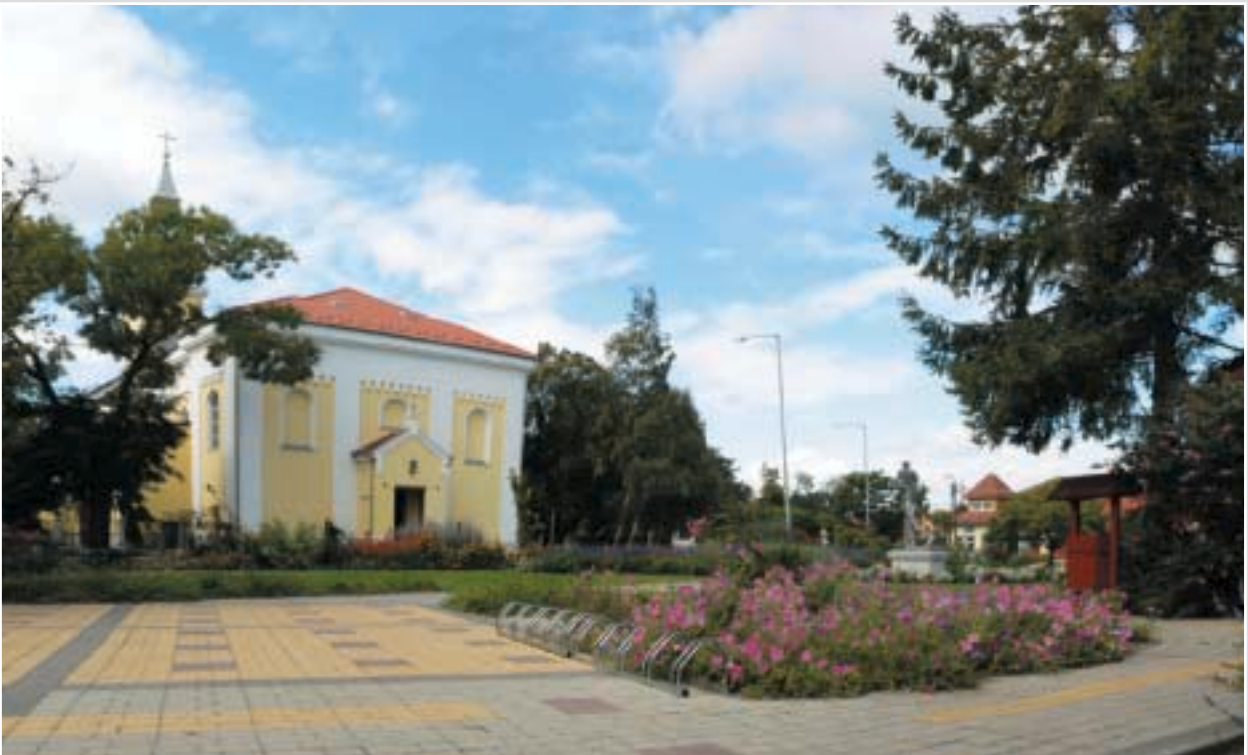
Uniós és hazai forrásból újult meg az általános iskola, a templom és az előtte lévő tér is