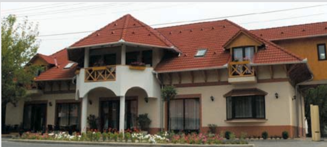
Étterem és panzió munkahelyteremtő támogatásból valósult meg 2007-ben