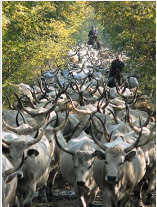
Harmóniában a természettel