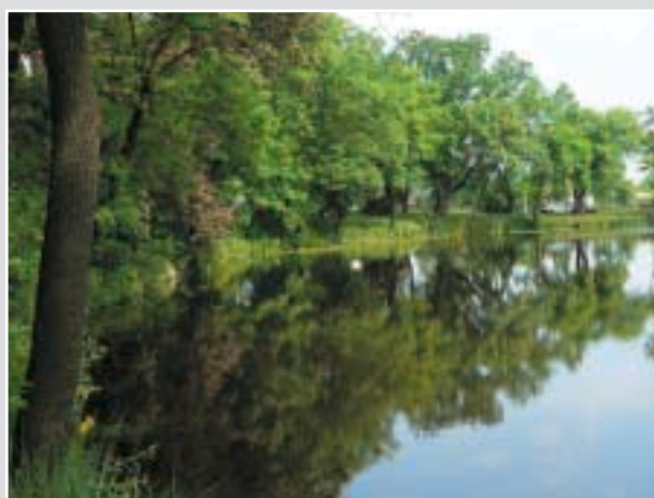
A Györgyey-kastély a tóval