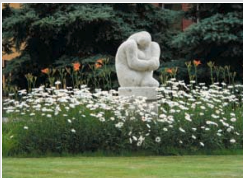
Köztéri szobraik is megújultak 2005-ben