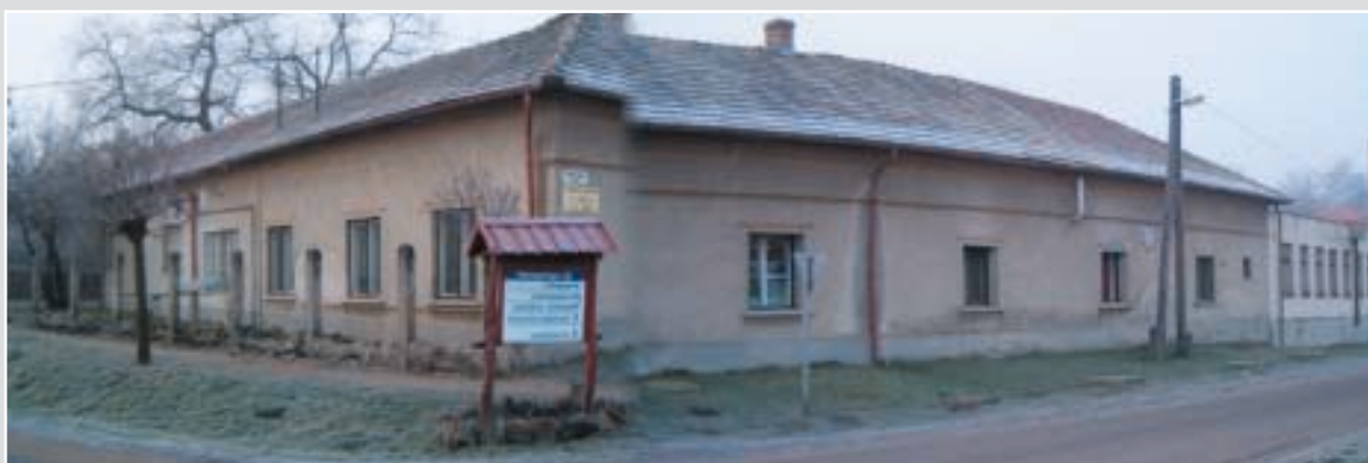
A községi óvoda 2005-ben...