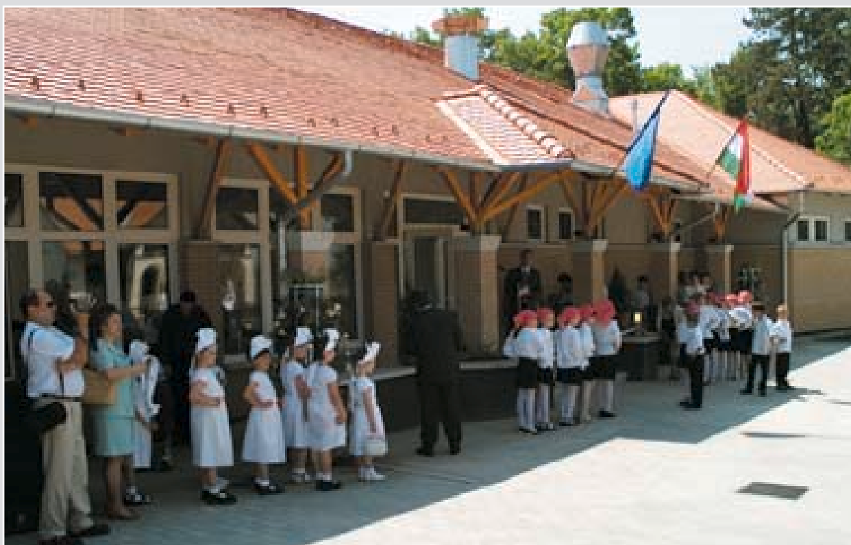
A községi konyha saját erőből valósult meg