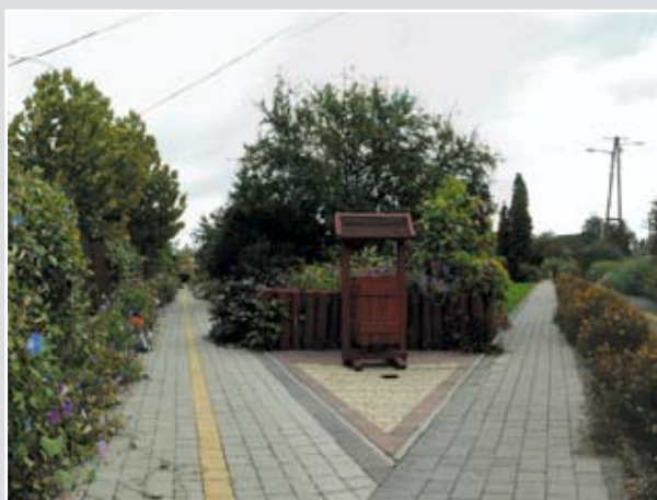
A falumúzeum és környéke is teljesen megújult 2005–2006-ban