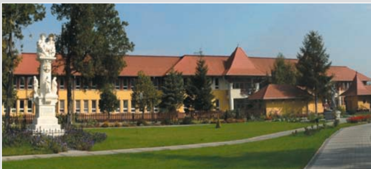
A település főtere 2005-ben