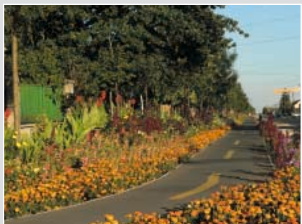
A kerékpárút 2004-ben épült