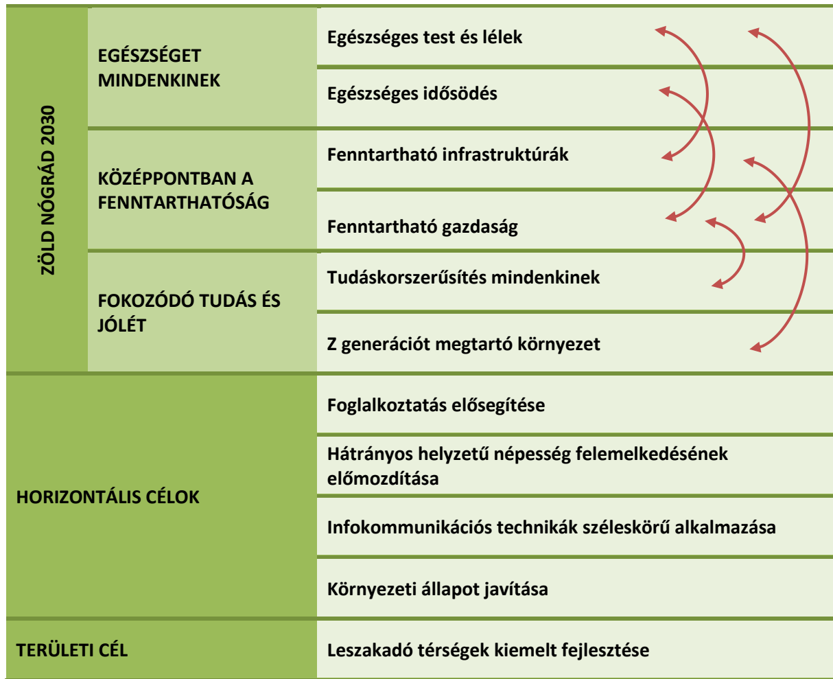
1. ábra: Nógrád megye Területfejlesztési Programjának célrendszere

A „Javaslattevő fázis”-ban megfogalmazott horizontális célokon túl a megyei programozásban elvárt a Terület- és Településfejlesztési Operatív Program PLUSZ (TOP PLUSZ) horizontális elveinek érvényesítése is.